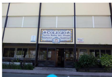
Entrada principal (Parking)