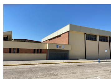
Puerta de alumnos